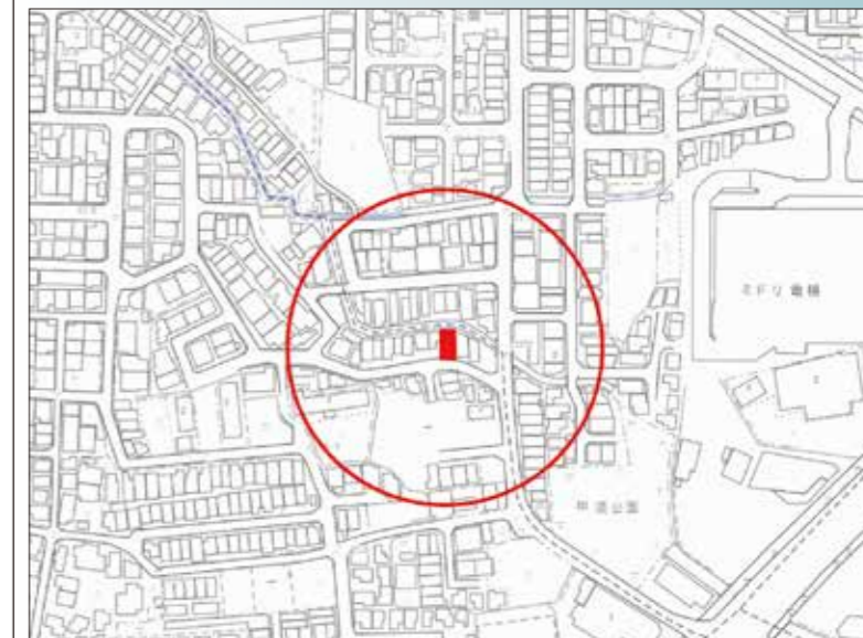
ナビ検索:大阪府枚方市須山町 62-4