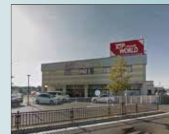
トップワールド枚方店 650m