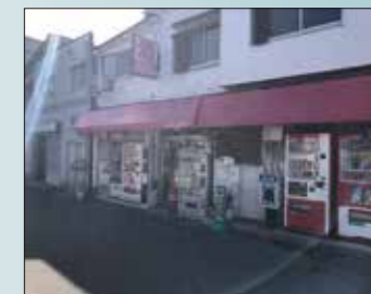
ヤマザキショップふみや 100m