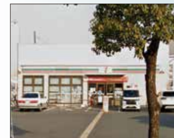
セブンイレブン枚方堂山店 400m