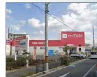
ドラッグストアアカカベ 550m